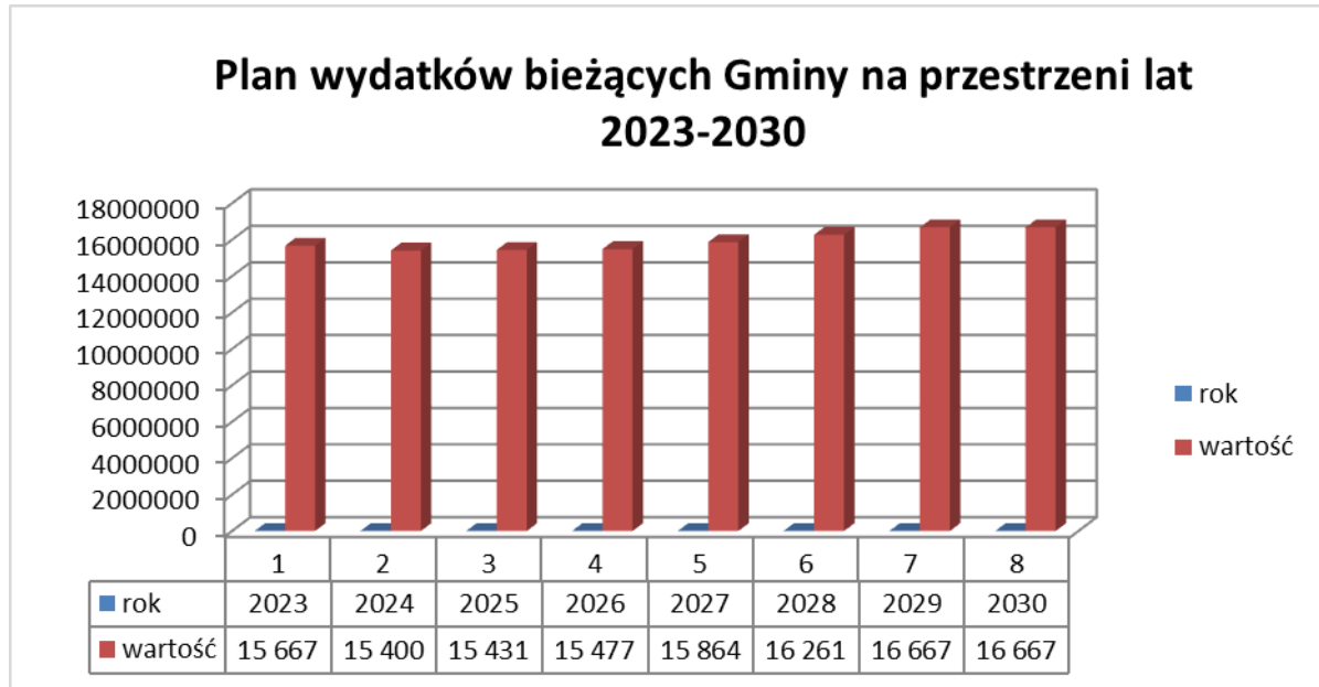
Wykres 3. obrazuje poziom dochodów bieżących i wydatków bieżących w latach 2023 -2030.