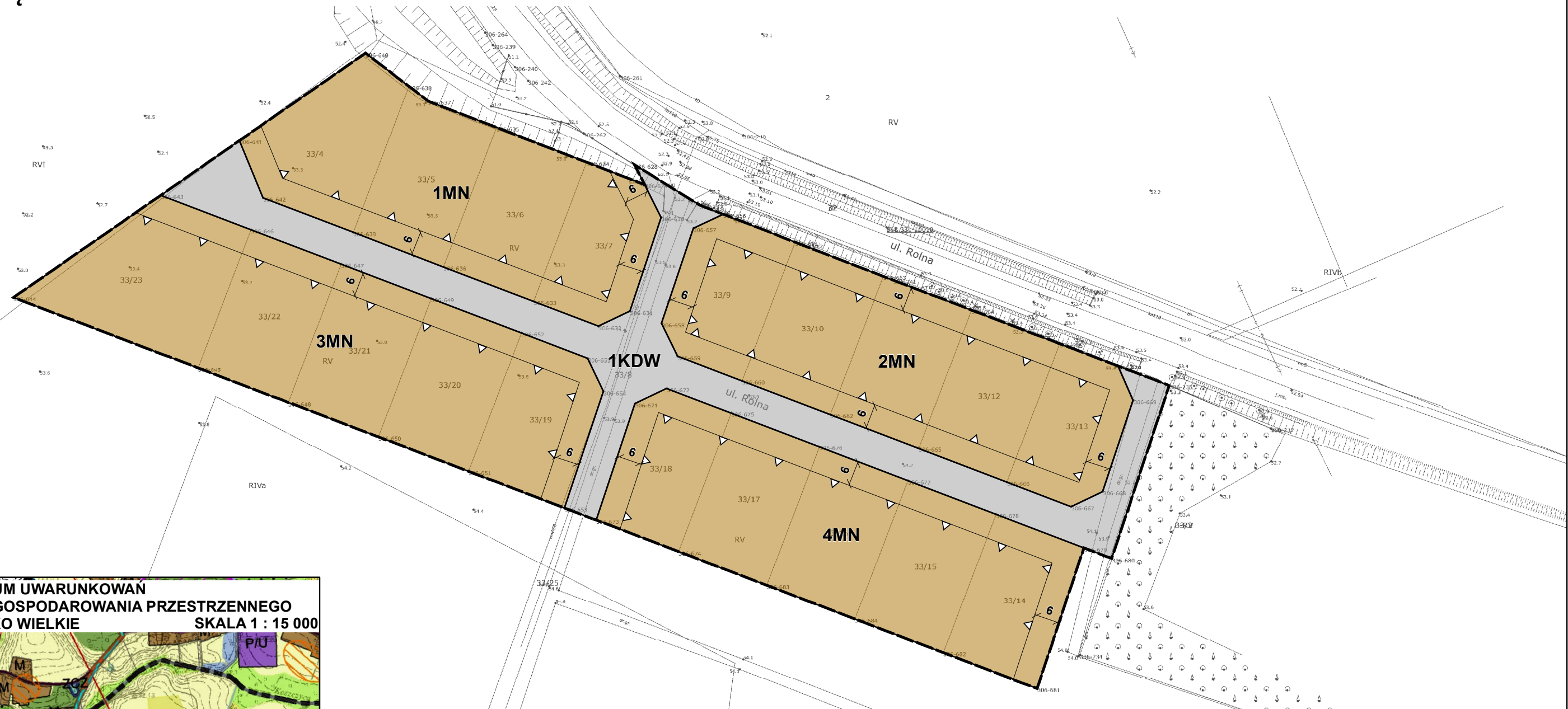
WYRYS ZE STUDIUM UWARUNKOWAN I KIERUNKÓW ZAGOSPODAROWANIA PRZESTRZENNEGO GMINY CHRZYPSCO WIELKIE SKALA 1 : 15 000