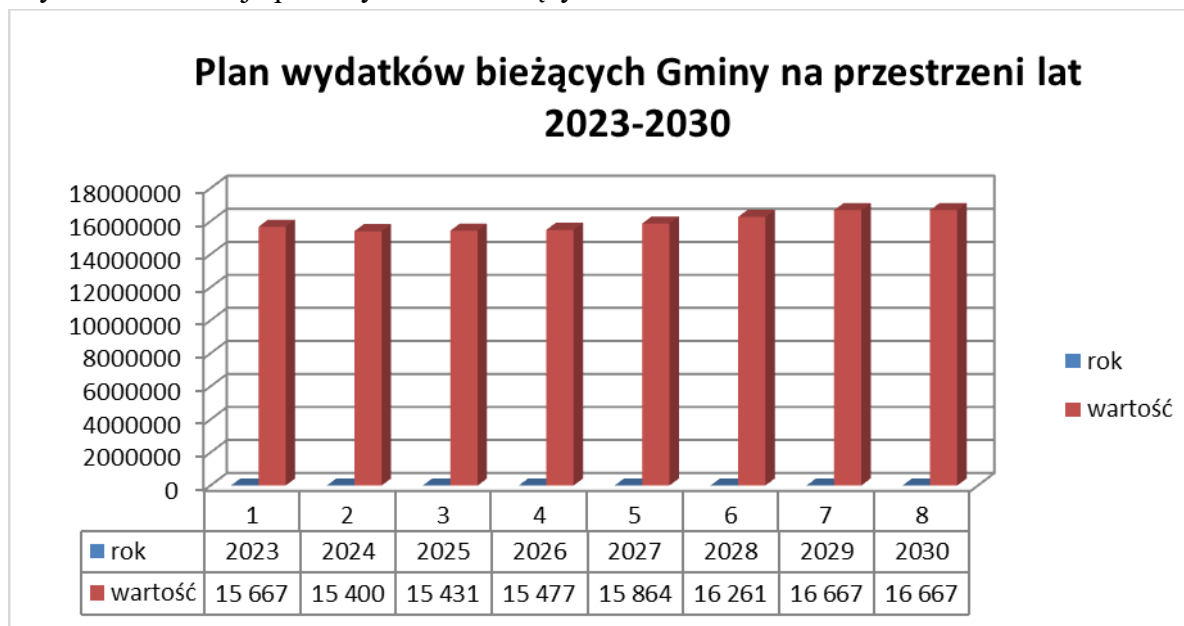
Wykres 3. obrazuje poziom dochodów bieżących i wydatków bieżących w latach 2023 -2030.