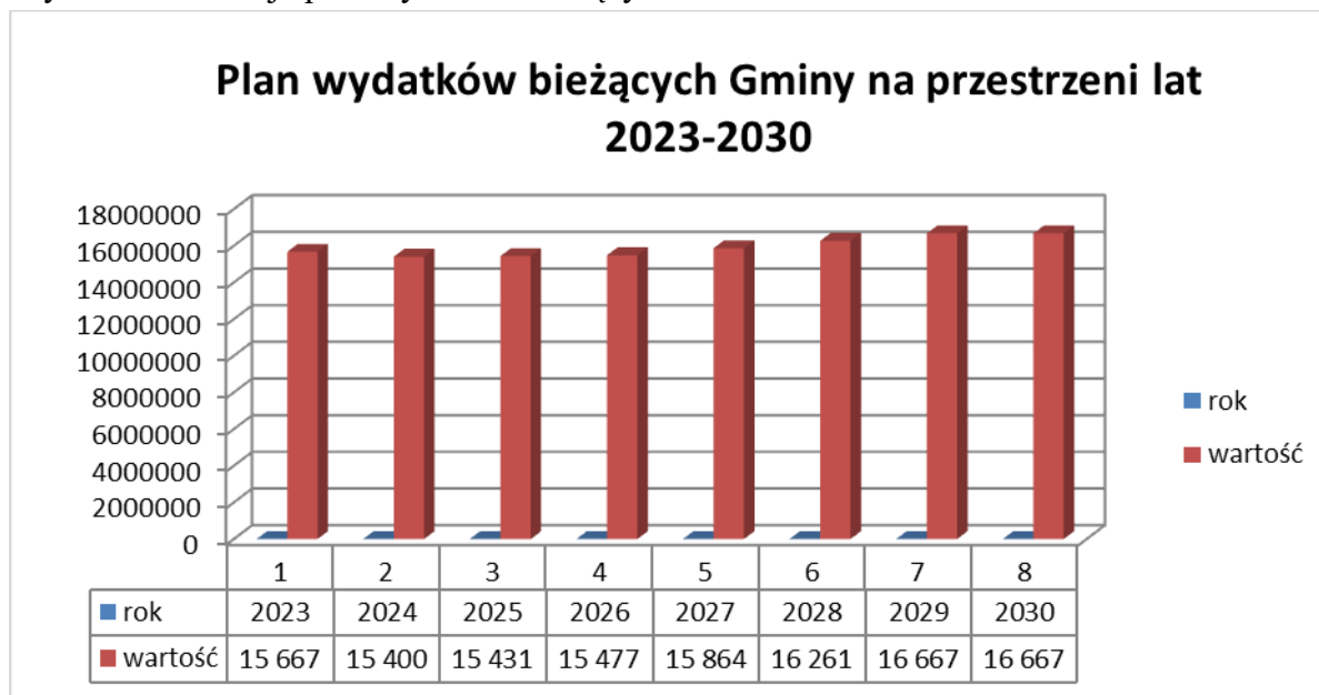
Wykres 3. obrazuje poziom dochodów bieżących i wydatków bieżących w latach 2023 -2030.