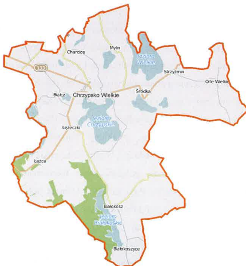
Ryc.1. Mapa gminy Chrzypsko Wielkie.

czterech lat, który realizowany będzie dostępnymi środkami prawnymi oraz finansowymi. Jednocześnie dokument ten stanowi instrument koordynujący proces tworzenia gminnych polityk przestrzennych i powinien spowodować poprawę stanu zachowania zasobów dziedzictwa kulturowego Chrzypaska poprzez właściwe – z punktu ochrony zabytków i opieki nad nimi – podejmowanie przez samorząd działań zarówno organizacyjnych, jak i finansowych zmierzających do osiągnięcia odczuwalnej i akceptowanej społecznie poprawy w tym zakresie. Kolejną rolą jaką spełnia niniejszy dokument jest uświadamianie potrzeb i zasad ochrony środowiska kulturowego wśród społeczeństwa, a także dążenie do włączania społeczności w proces sprawowania opieki nad zabytkami poprzez tworzenie i wspieranie inicjatyw mających taką opiekę na celu.